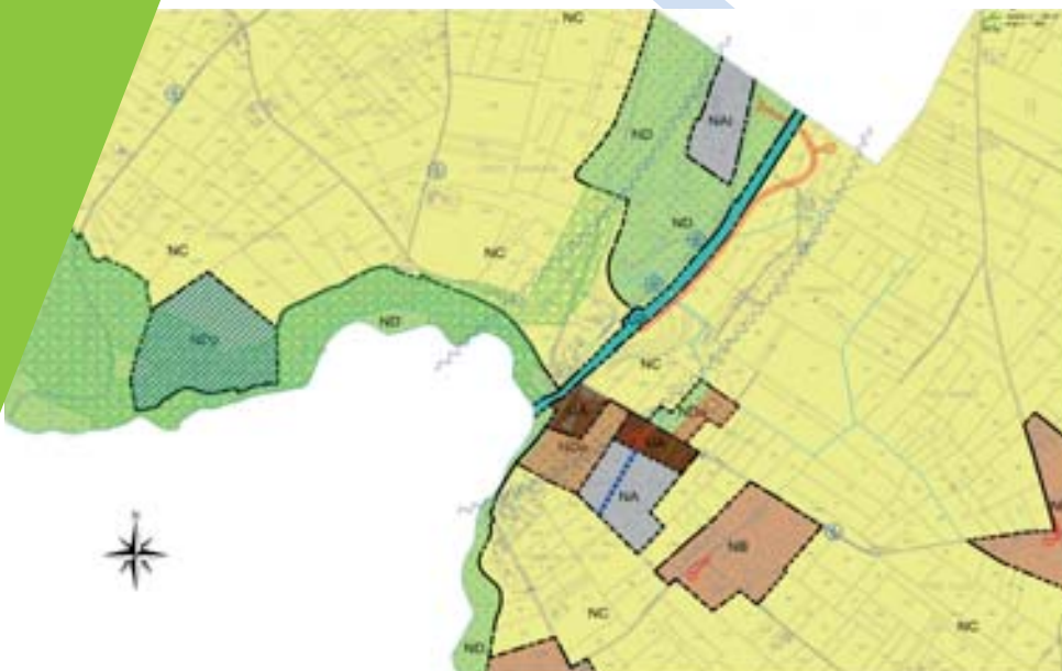
Carte à l'aptitude des sols à l'assainissement autonome