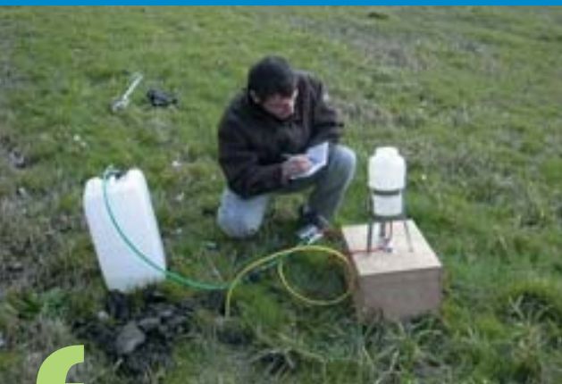
Essai Porchet pour l'aptitude des sols