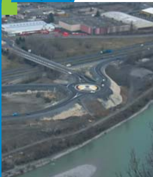
Échangeur Gringalet sur A480

mise en forme technique et paysagère de projets de desserte de bâtiments