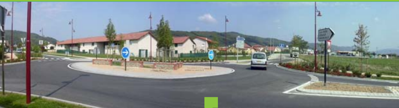
Carrefour giratoire sur RD 73 au Grand-Lemps (38)